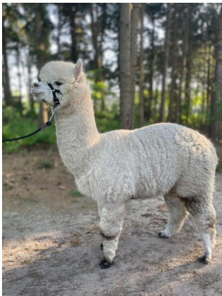
Alpaca Photo 2