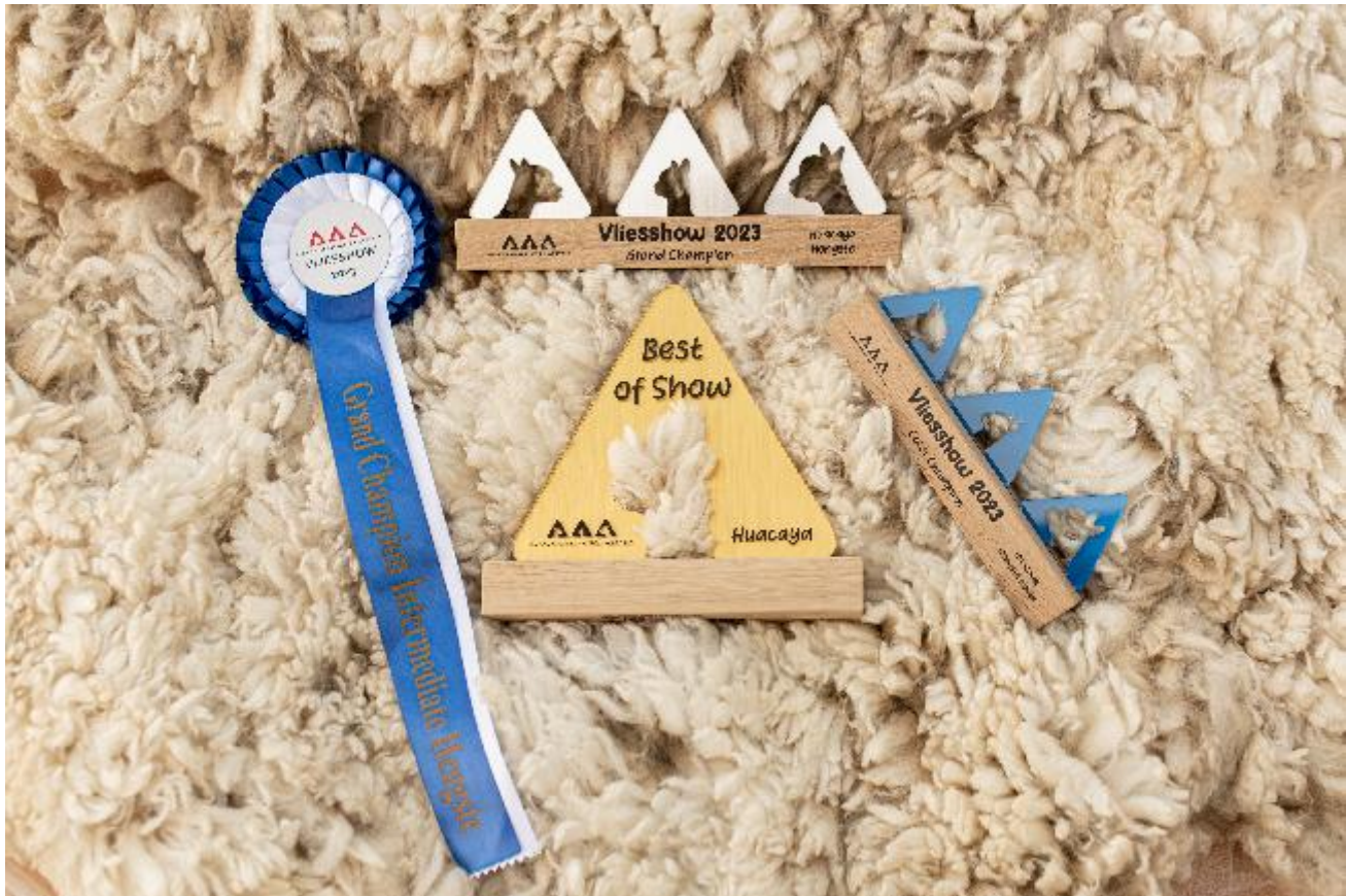
Alpaca Photo 3