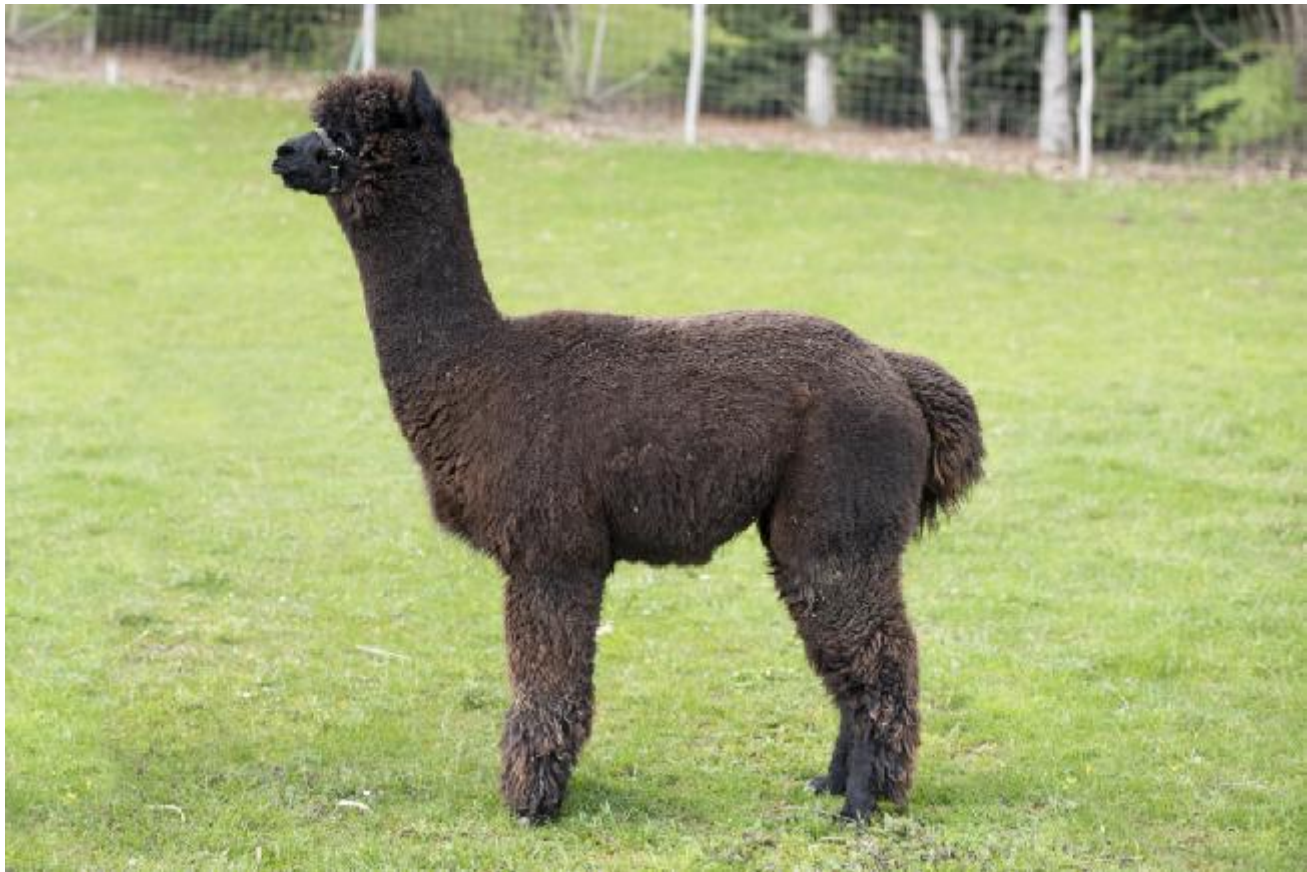
Alpaca Photo 3