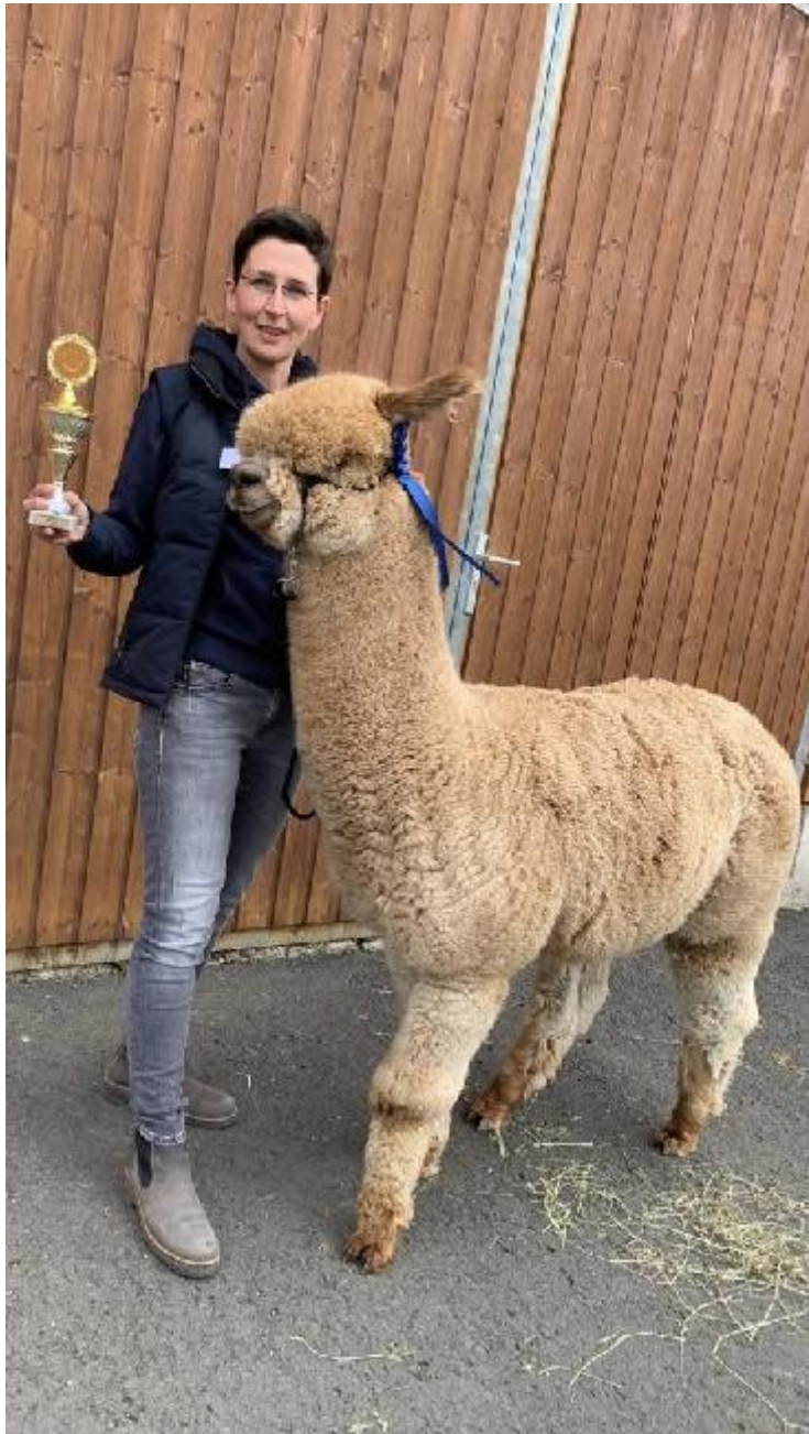
Alpaca Photo 1