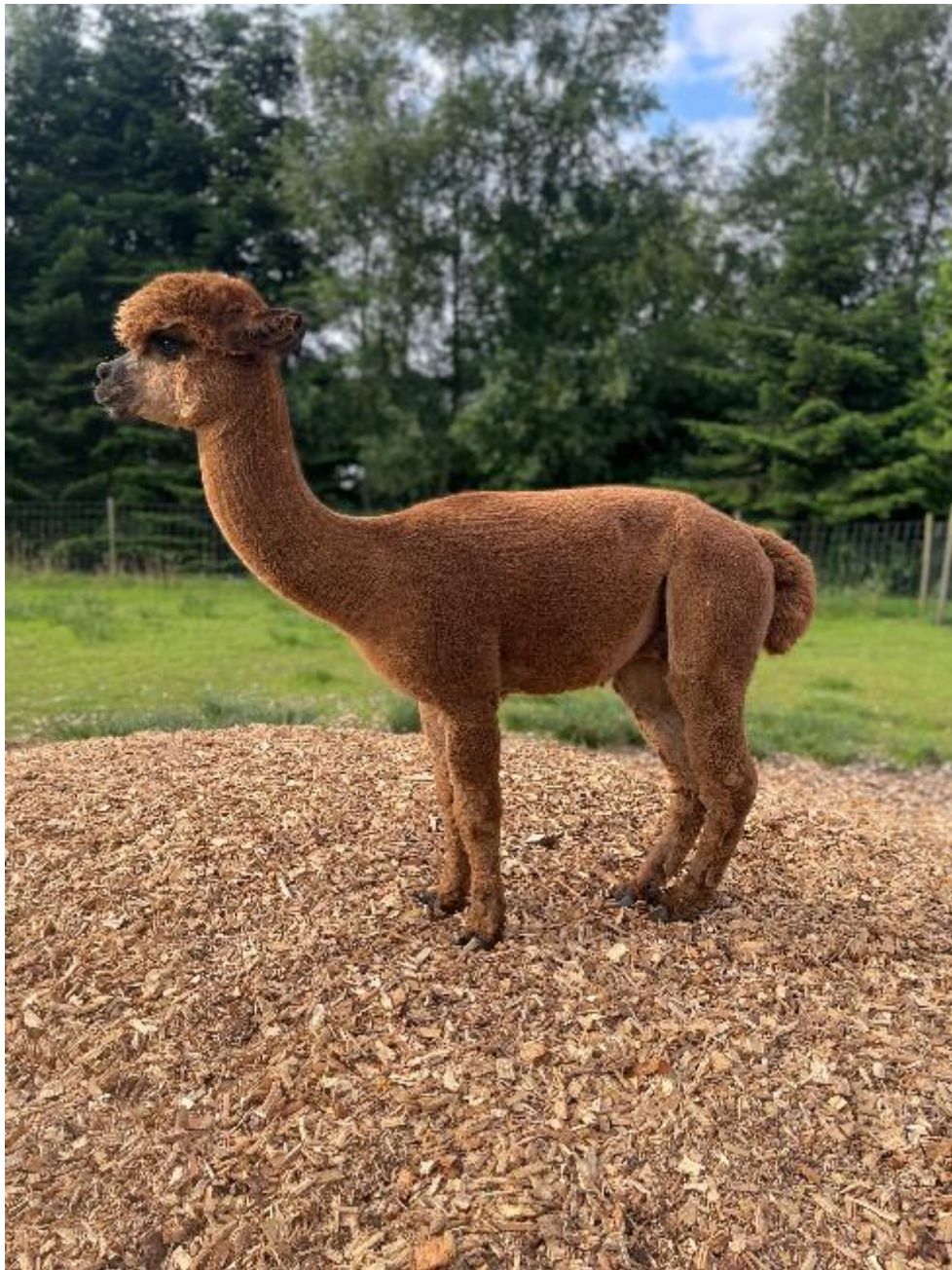
AL Kleiner Hobbit, genetisch schwarz