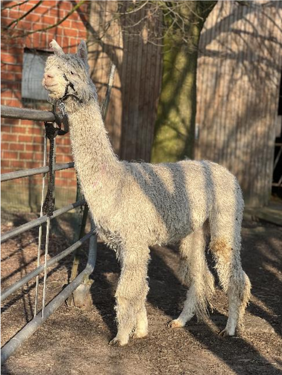
Alpaca Photo 1