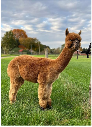
Alpaca Photo 2