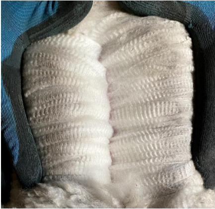
Alpaca Photo 3