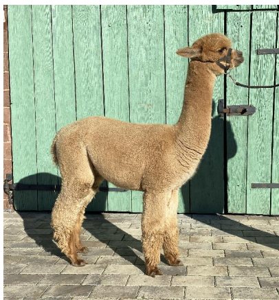
Fairytale Newton 3. Vlies