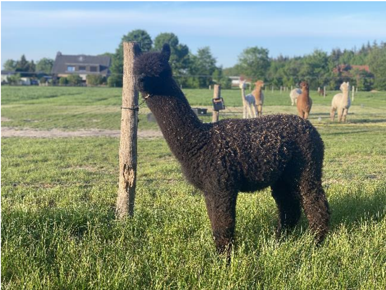
Alpaca Photo 1