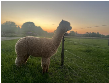
2. Vlies (2022)