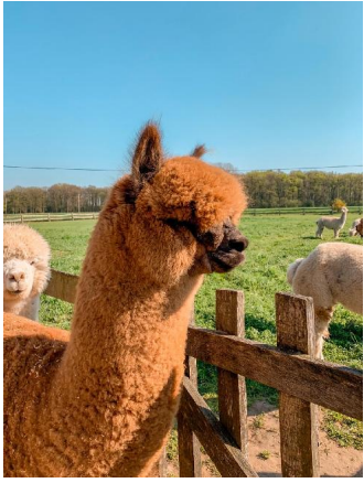
Alpaca Photo 2