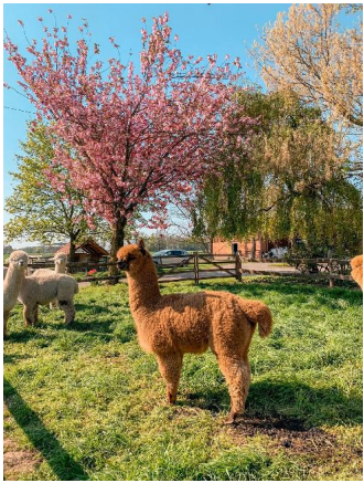
Alpaca Photo 3