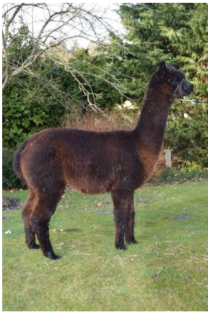
African Sun - schwarzer Deckhengst

Korrechter, starker Körperbau - typvoller Deckhengst