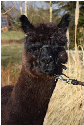
Color Champion Erfurt 2017