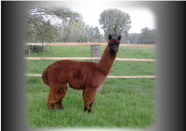
NAO Lord Nero von Lord Nelson