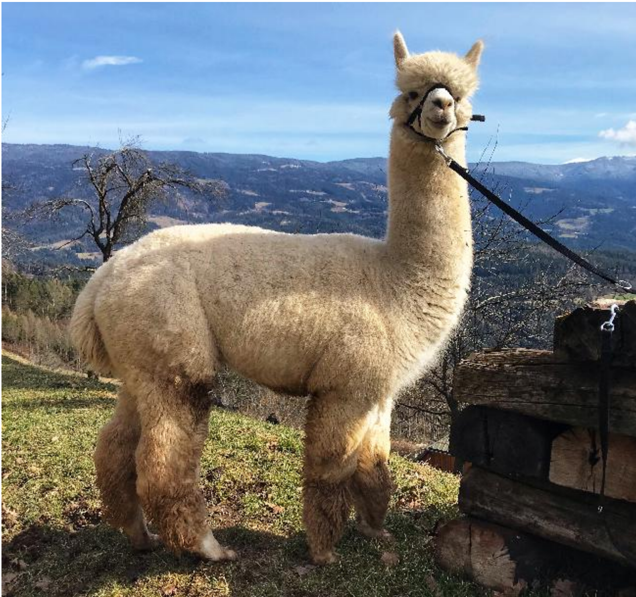
Alpaca Photo 1

2. Platz Hengste weiß 25-36 Monate Show AAA in Wieselburg 2020