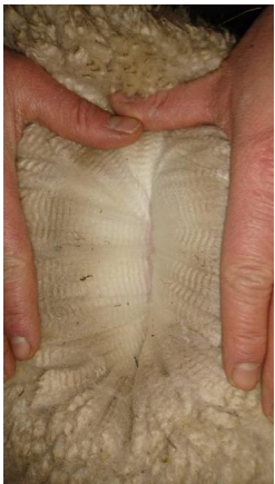
SWS Satinero - 3. Vlies