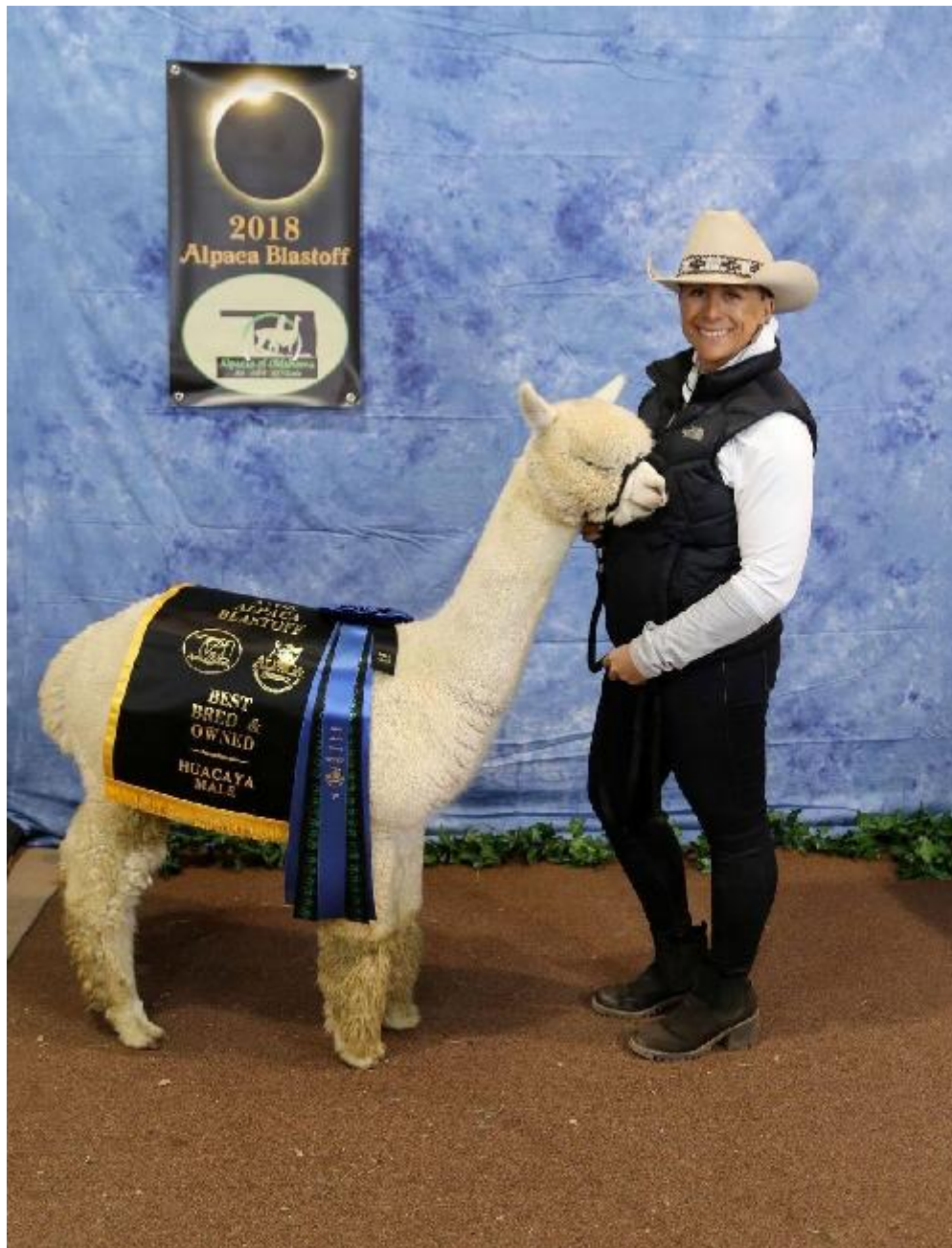
Alpaca Photo 1