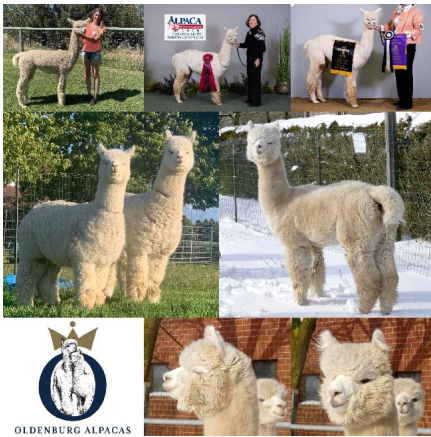
1. und 2. Vlies