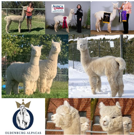
1. und 2. Vlies