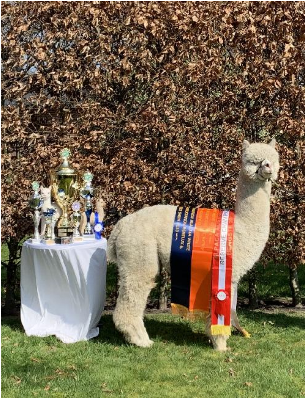
Alpaca Photo 1