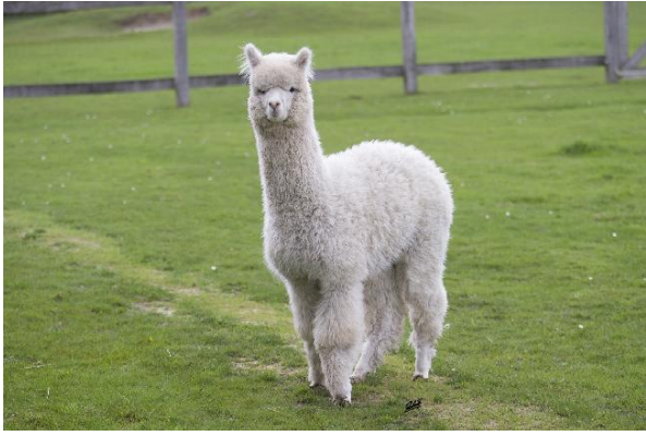
Alpaca Photo 2