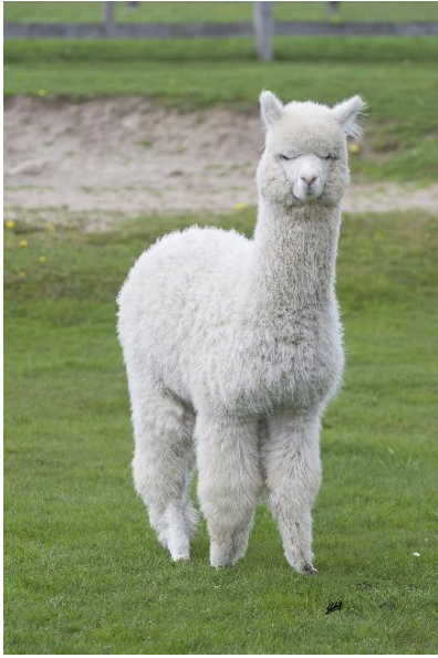
Alpaca Photo 3