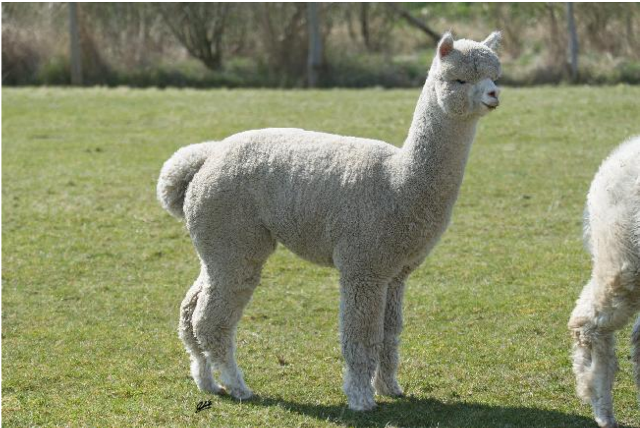
Alpaca Photo 1