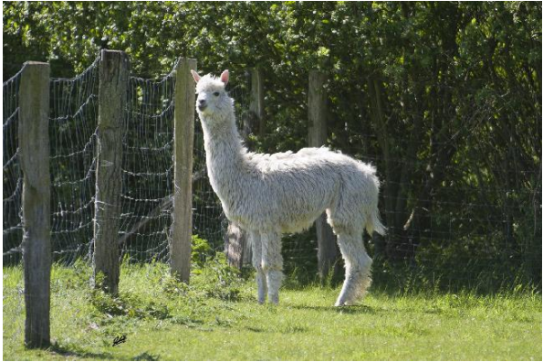
Alpaca Photo 2