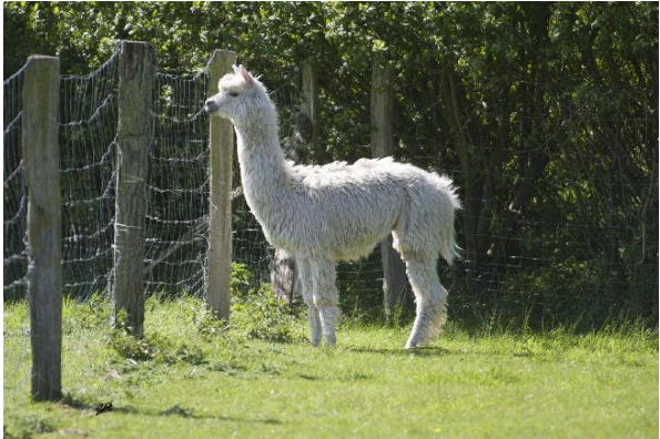
Alpaca Photo 3