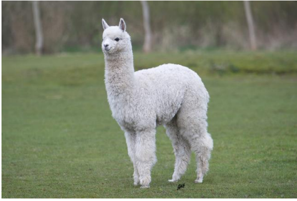
Alpaca Photo 2