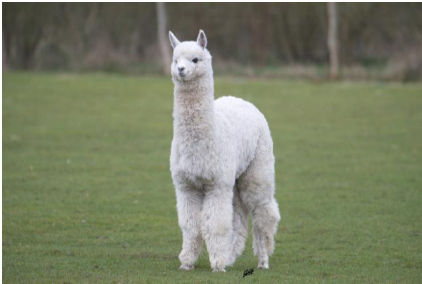
Alpaca Photo 3