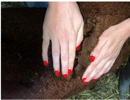
Als Fohlen vor der Cria Schur