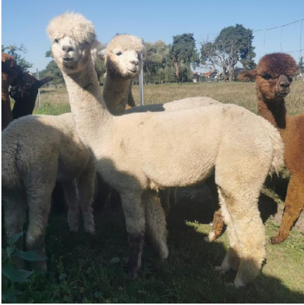
Alpaca Photo 2