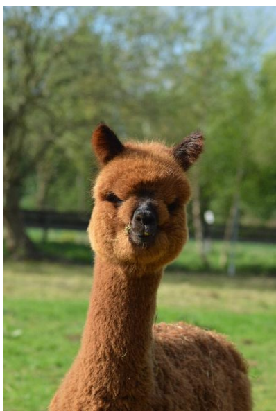
Alpaka Foto 2