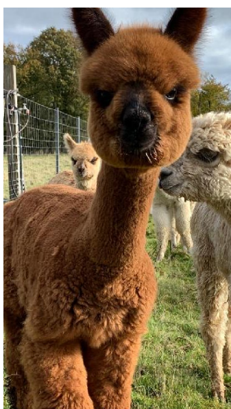
Alpaka Foto 3