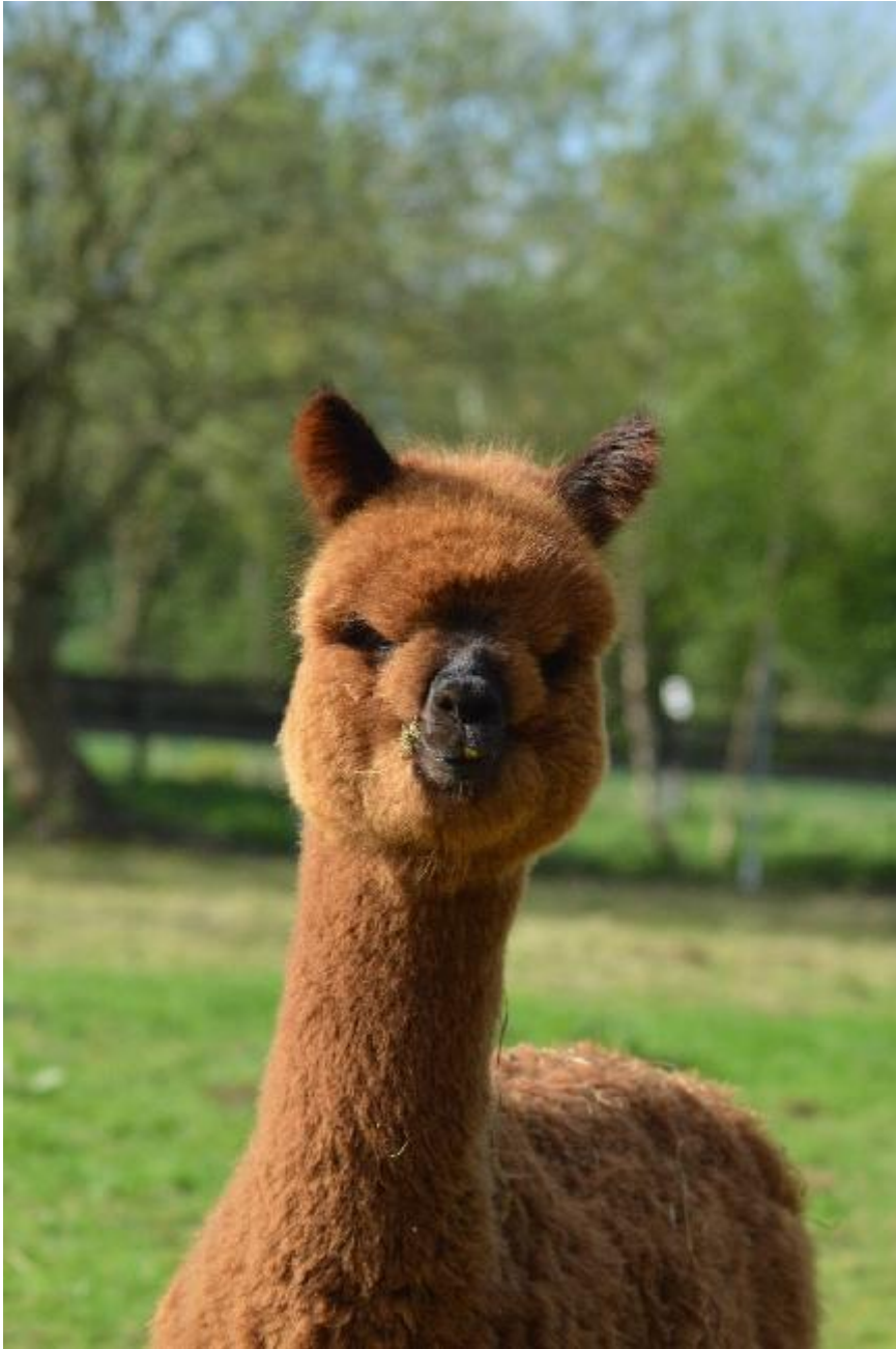
Alpaca Photo 1