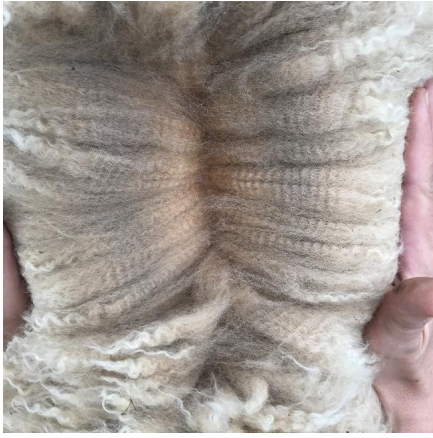
aktueller Deckhengst WEST MARBLE