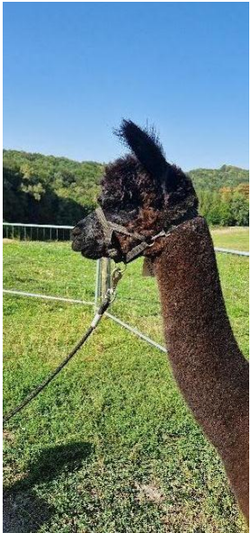
Alpaca Photo 3