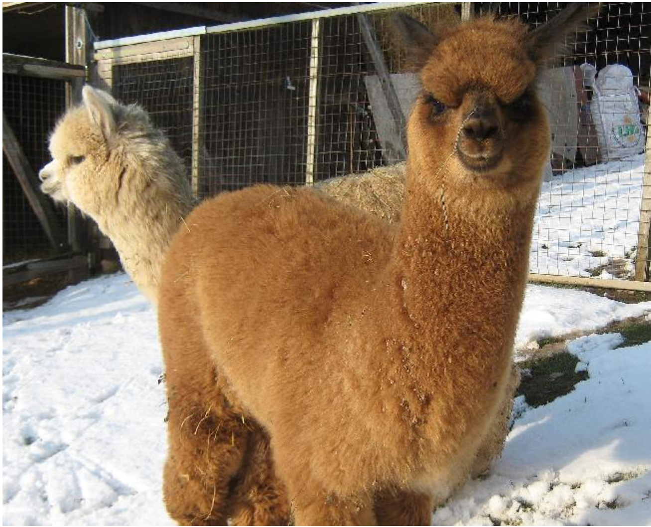
King als Fohlen