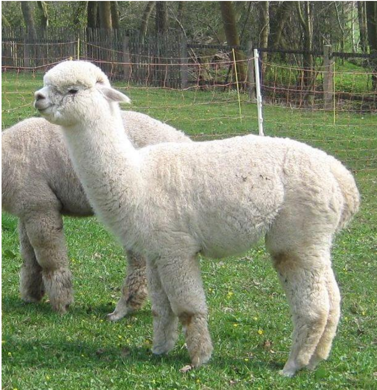
Alpaca Photo 1

z.B. 2016 Burgstädt 2. Platz Hengste älter 36 Monate (nach Res.Champion)