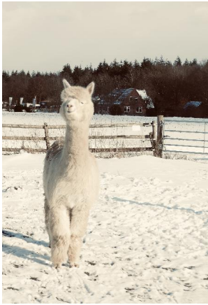
Alpaca Photo 2