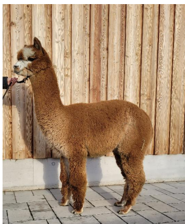
Alpaca Photo 1