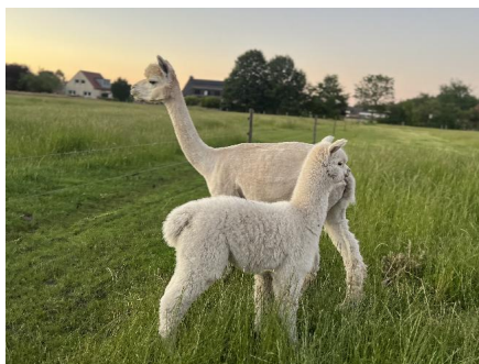
Alpaca Photo 2