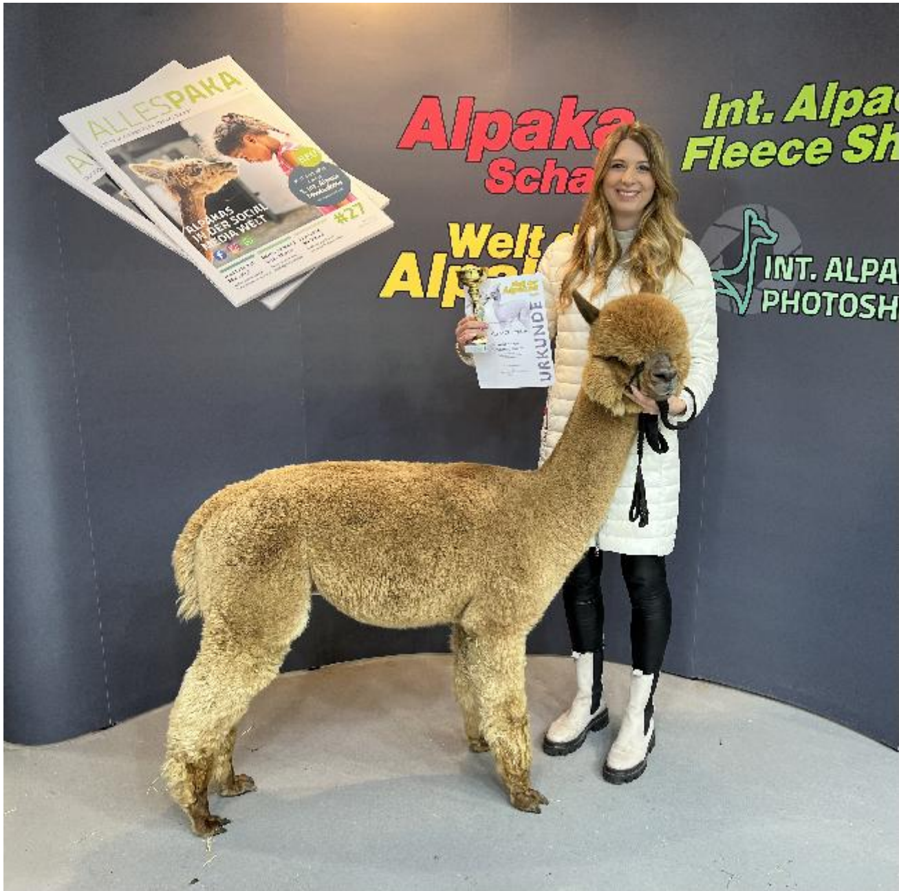
Alpaca Photo 1