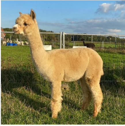
Alpaca Photo 2