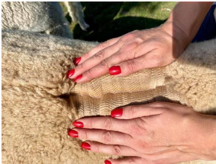
Fleece von ihrem Fohlen aus 2023