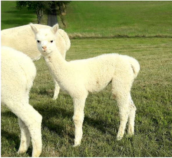
MMU Cia Tayrona am 23.März 2024