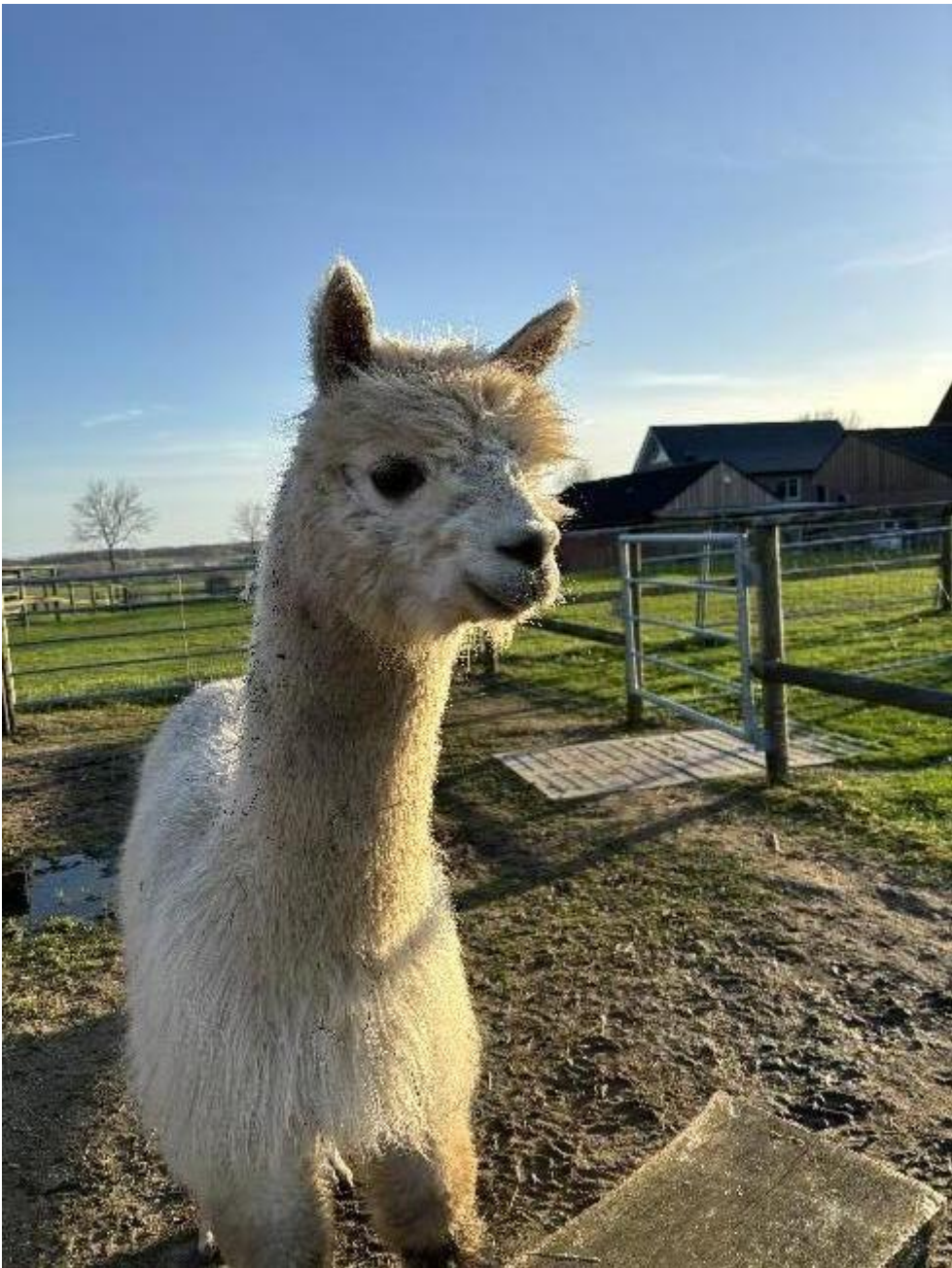
Alpaca Photo 1