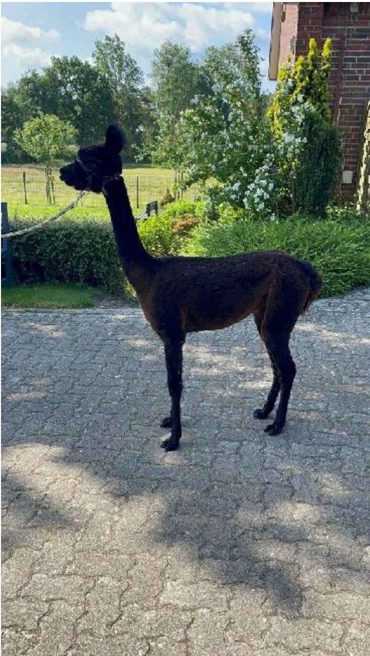
Alpaka Jungstute Mary Lou