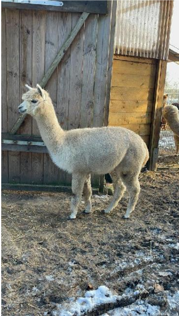
Alpaka Jungstute Marilyn