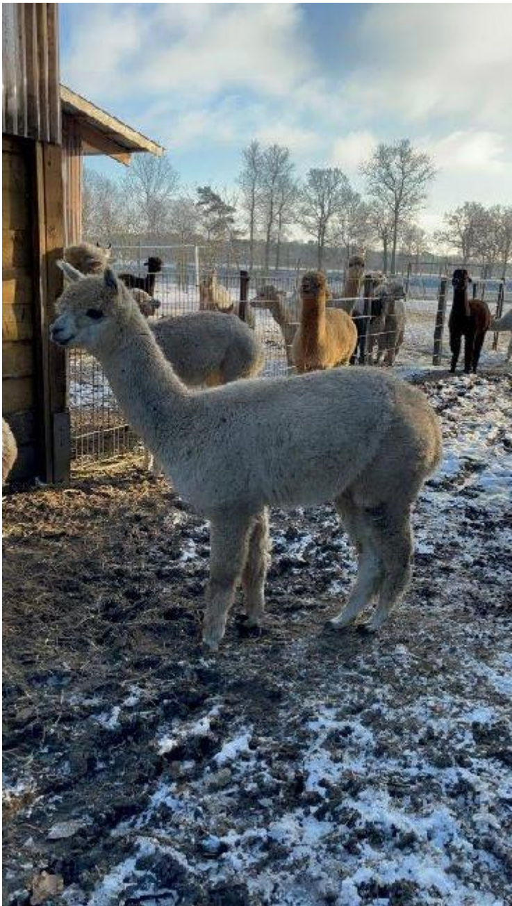
Alpaka Jungstute Mel B