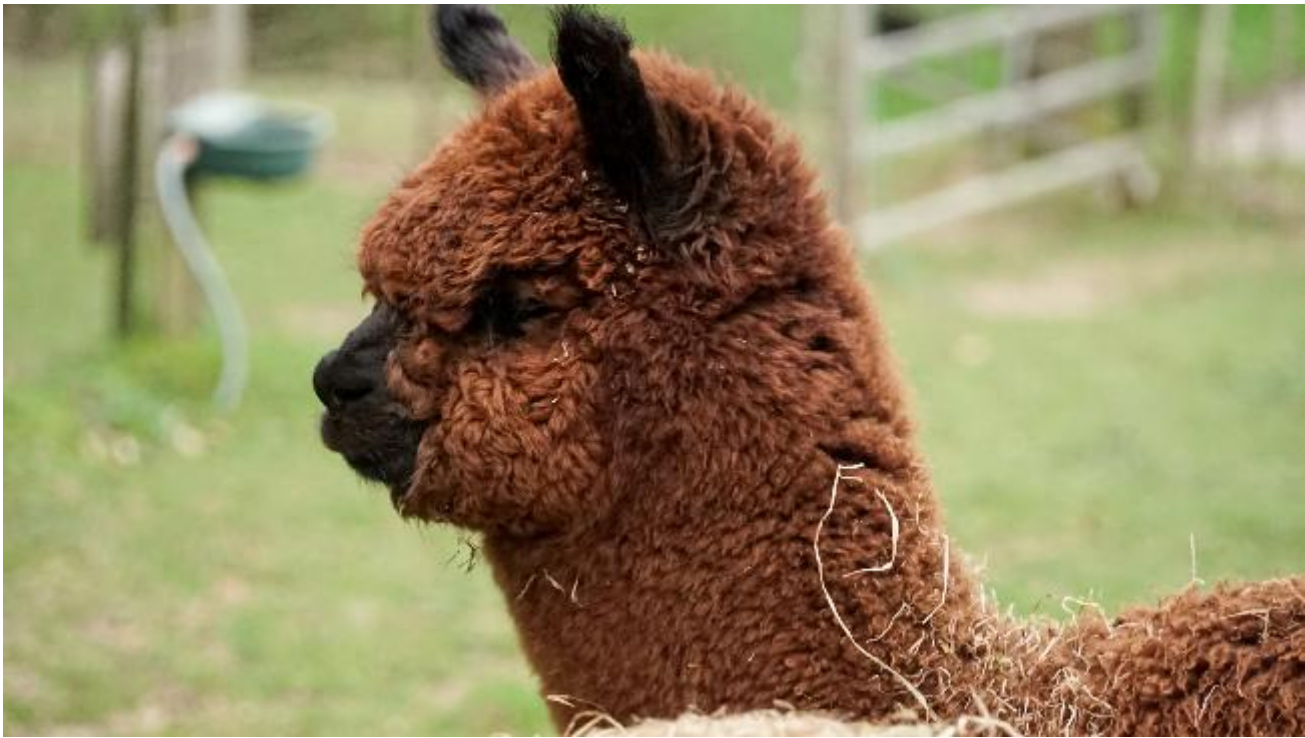
Alpaca Photo 2