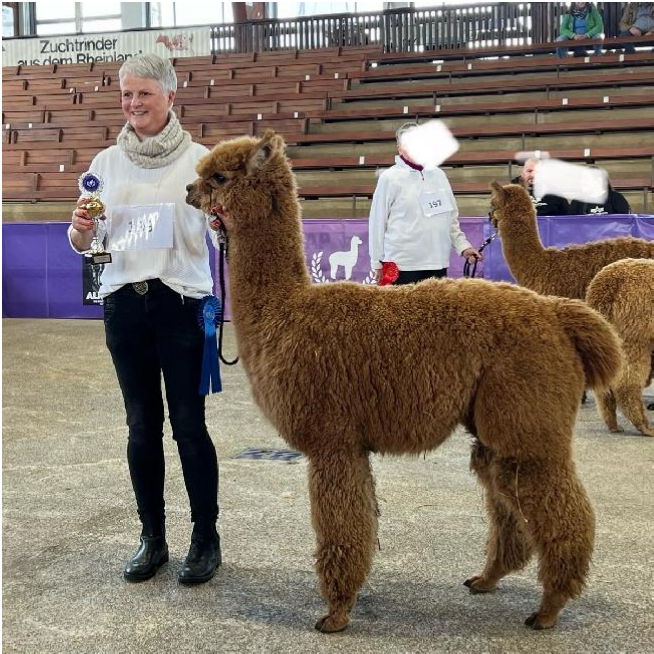
FAB Djamal Color Champion Iwan male