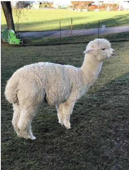
Alpaca Photo 2