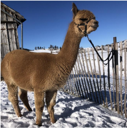
Alpaka Foto 3