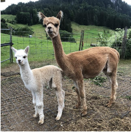
Alpaka Foto 2