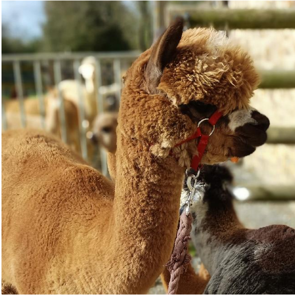
REA et AURANE