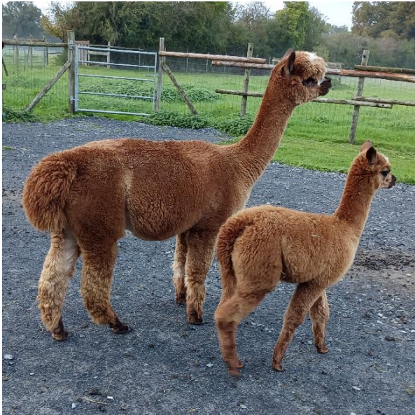
REA après la tonte