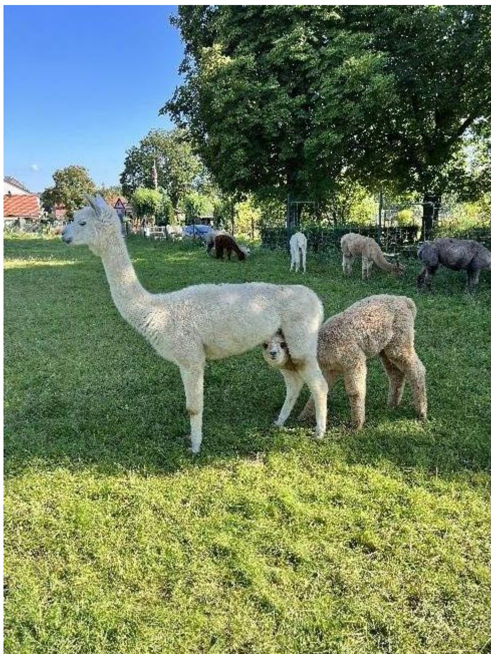
Albina mit Fohlen