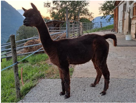
Alpaca Photo 2