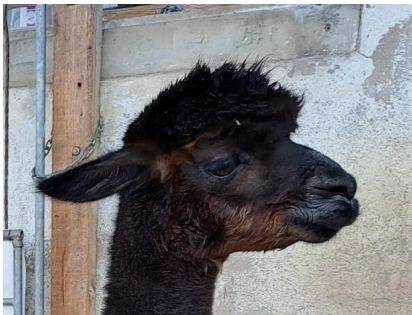
Alpaca Photo 3