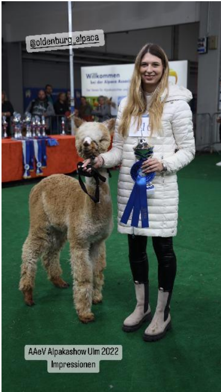
AAeV Alpakashow Ulm 2022 Impressionen