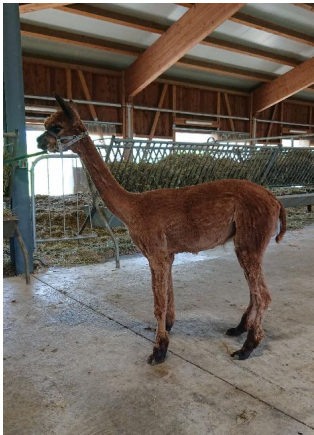
AHB Finn 2022