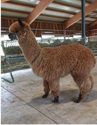
Nach der Schur 2023